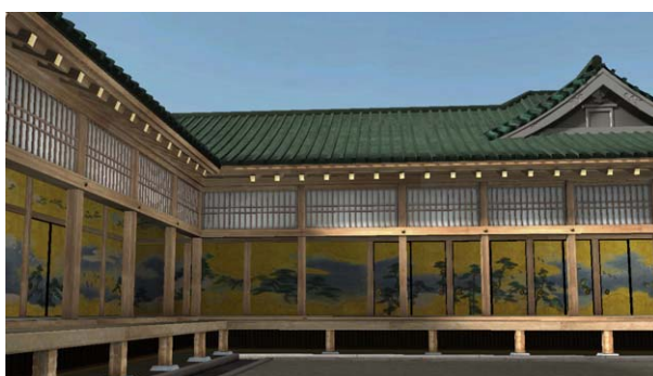
▲「忠臣蔵」で有名な本丸御殿の松の廊下

(上・左下)VR作品「江戸城一本丸御殿と天守」より 【制作・著作】東京都江戸東京博物館／凸版印刷株式会社