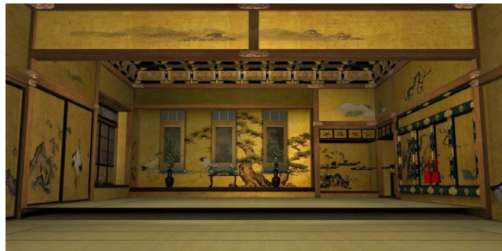
▲弘化2年(1845)再建の本丸御殿大広間