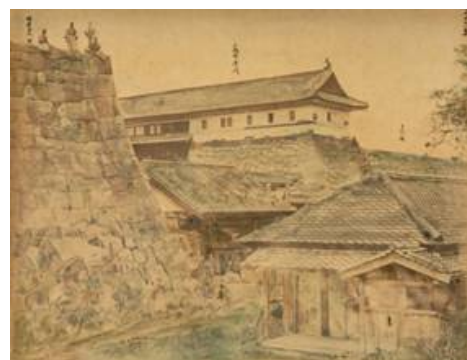
▲「旧江戸城写真帖」(蟻川式胤[製作] 東京国立博物館蔵)

(上・左下)VR作品「江戸城一本丸御殿と天守」より 【制作・著作】東京都江戸東京博物館／凸版印刷株式会社