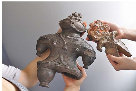
実物大の土偶のレプリカに触れて大きさや重さを体感